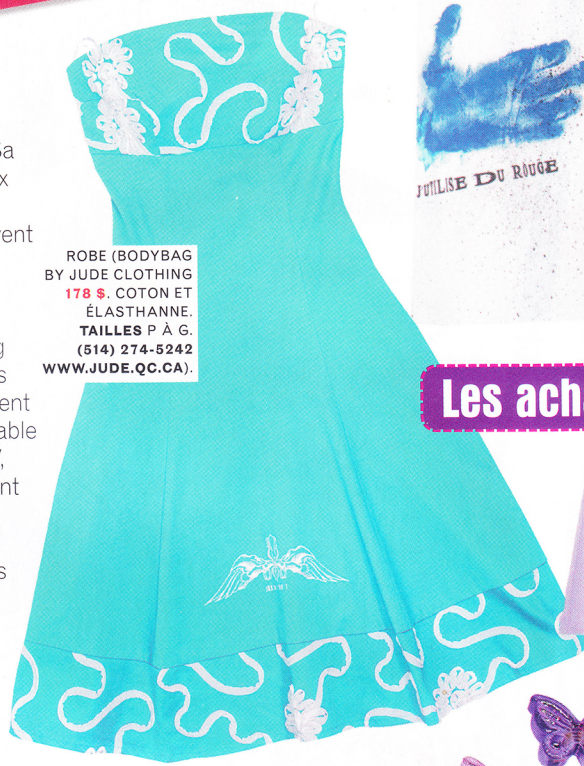
ROBE (BODYBAG BY JUDE CLOTHING 178 $. COTON ET ÉLASTHANNE. TAILLES P À G. (514) 274-5242 WWW.JUDE.QC.CA.