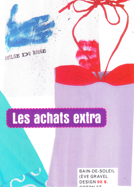
T-SHIRT (OÖM ETHIKWEAR 42,99 $. COTON. TAILLES P À G. WWW.OÖM.CA).