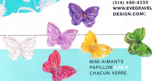
MINI-AIMANTS PAPILLON 0,50 $ CHACUN. VERRE.